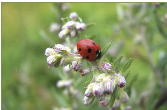
Zevenstippelig lieveheersbeestje Gilbert De Ghesquière

We liepen hetzelfde traject als in mei dit jaar en in totaal verzamelden we 109 lieveheersbeestjes met daarbij nog eens 42 larven, allemaal door kloppen en op zicht. Ter vergelijking: in mei verzamelden we 163 LHB'-tjes. Al bij al viel het totale aantal dus nogal mee, de grote verrassing waren de soorten die we vonden!