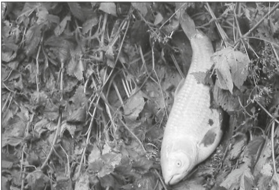
Goudkarper in Bos t'Ename

De Sombere honingzwam ( Armillaria ostoyae ), een plaatjeszwam met manchets in de Amerikaanse staat Oregon (en die ook bij ons voorkomt), is naar schatting 2400 jaar oud en heeft een ondergronds mycelium met een omvang van 890 hectare. Daarmee is deze schimmel het grootste levende organisme ter wereld. Ook in Zwitserland in het Nationaal Park in de streek Engadin komt deze schimmel met een grote omvang voor. Hier is de schimmel ongeveer duizend jaar oud en ongeveer 800 meter lang en 500 meter breed.