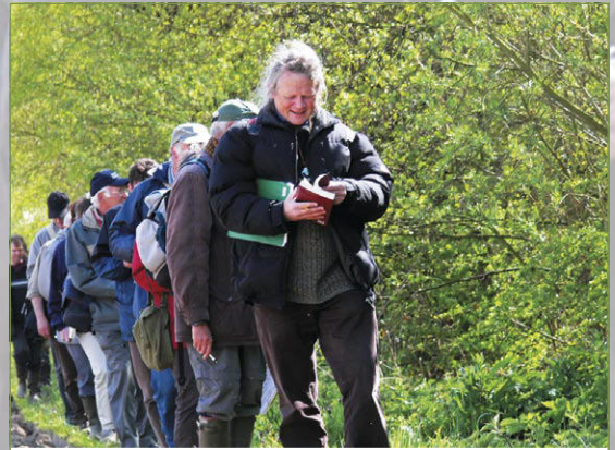
hoe was die naam alweer?

Ik ben zo slecht in namen dat het geen naam heeft. Laat staan al die Latijnse namen. Het moeten toch allemaal zeer slimme mensen zijn die al die planten en beestjes zo uit het hoofd kunnen benoemen, denk ik terwijl ik met de plantenwerkgroep een vierkante kilometer te Roborst uitkam. Als het nu maar enkele namen waren, maar neen, mijn mond valt helemaal open als ik de vlotheid hoor waarmee de plantkundigen hun omvangrijke groene wereld vastleggen. Even wordt het me teveel en zakt de moed me in de laarzen.