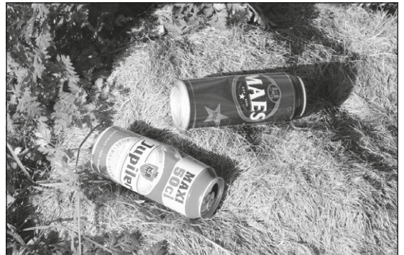
Eieren van ' Pippo maesensis ' en ' Imperius inbevius ' op braakbal van ' Griffonotis vomiterbus ' (of ' G. remorcus '?)

de rest. Slechts één soort willen we nog vermelden: iedereen kent wel de 'Grasmaaiseltrap' ( Griffonotis vomiterbus ). Dit is een behoorlijk groot creatuur, verwant aan de Griffioen, dat vrij omvangrijke braakballen produceert van wat er uit ziet als, tja, grasmaaisel. Van het gewicht van sommige hopen kan men afleiden dat een volwassen exemplaar een spanwijdte van minstens vijftien meter moet bereiken. Gelukkig zijn het ook schuwe schepsels: heeft ooit al iemand het ultieme braakmoment kunnen vastleggen? Ook heeft nog niemand zwart op wit kunnen aantonen dat het in onze contreien om een zogenaamde 'Trektrap' gaat ( Griffonotis remorcus ). Dat is een Griffonotis die iets voorttrekt wat er achter aan bengelt. De enige waarneming komt van iemand die midden in de nacht terugkwam