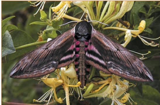
Ligusterpijlstaart op Kamperfoelie

Andere minder bekende soorten zijn niet minder mooi zoals de Vliervlinder, Zomervlinder, Eikenblad,