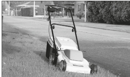
... een van de grootste uitvindingen, belangrijker dan kruimeldieven en kruisraketten ...

ons het gazon gegeven, dat groene grasveld naast ons huis, waar we argeloos kunnen genieten van de natuur wat verder weg.