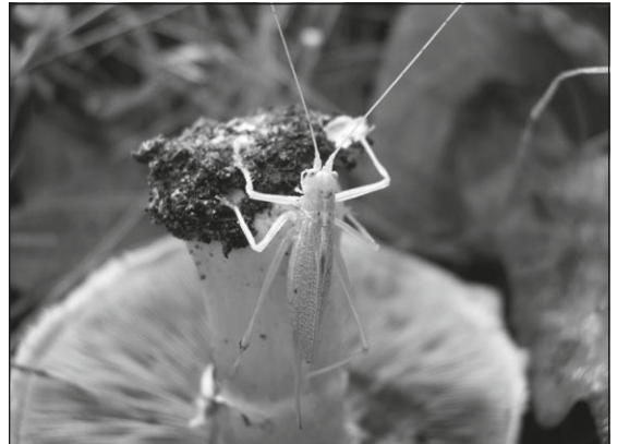
Sprinkhaan op champignon Gilbert De Ghesquière